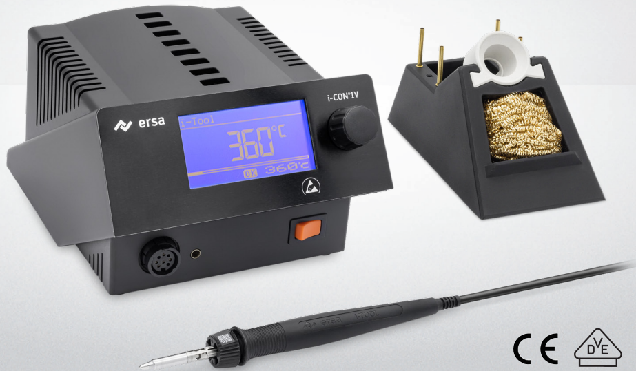
i-CON 1V MK2 mit i-TOOL MK2