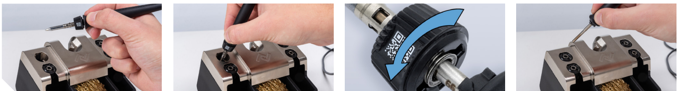
Blitzschneller Spitzenwechsel: von Hand oder mit Hilfe des Ablageständers 0A58, kompatibel mit i-TOOL TRACE und allen LötKolben der i-TOOL MK2 (optional).